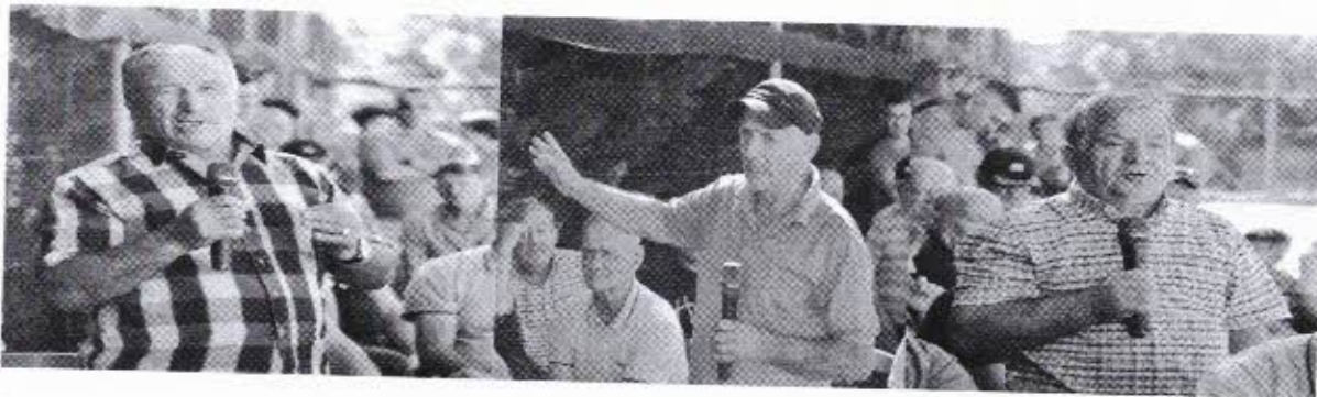
Foto të takimit me temë: “Konsultimi i ndryshimeve të Paketës Fiskale 2025 dhe rishikimi i ndryshimeve të projekt dokumentit për hartimin e Buxhetit Afatmesëm 2025-2027”