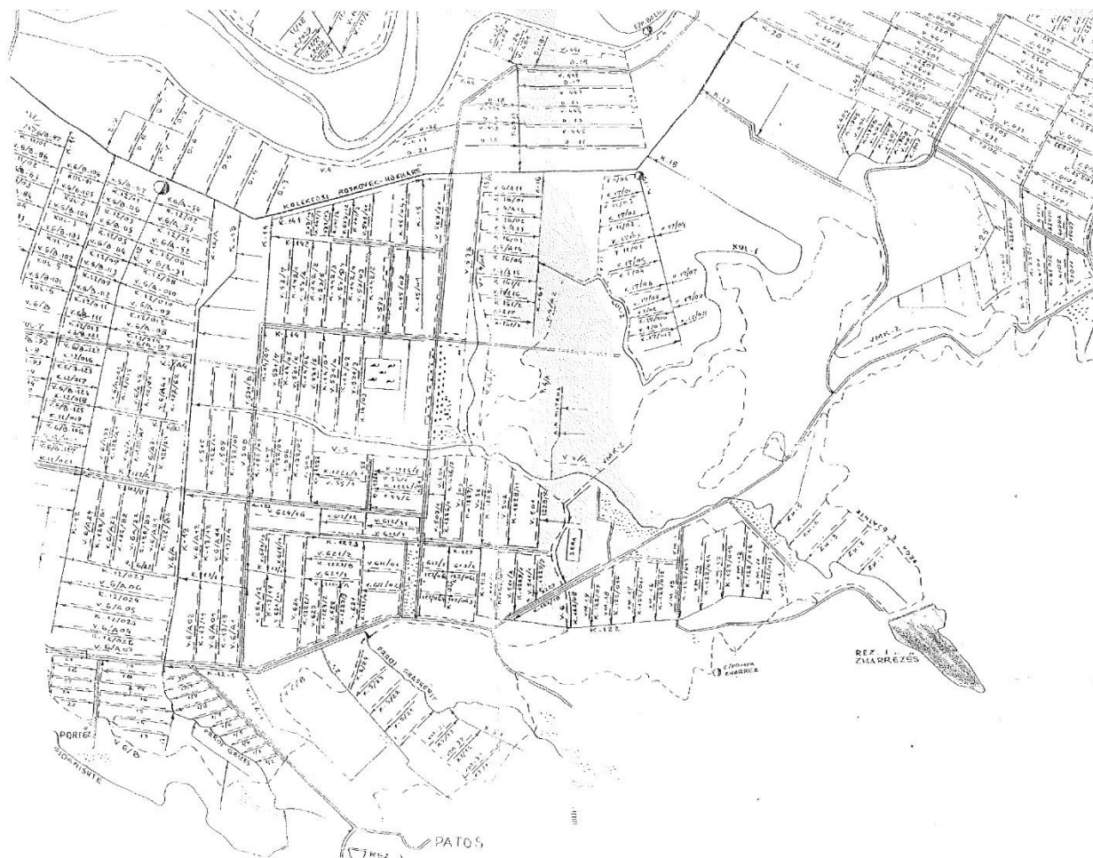
Harta e sistemit (DUK Fier)

Deri në 6-mujorin e parë të vitit 2024 është ndërhyrë në pastrimin e 66 % të sistemit kullues total dhe vazhdon mirëmbajtja e tyre. Në sistemin ujitës është ndërhyrë më pak për shkak se fokusi ka qenë në mbrojtjen nga përmbytja si dhe për shkak të mungesës së burimeve ujore për furnizimin me ujë të skemave.